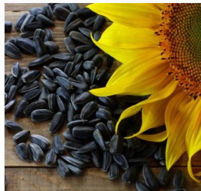
Арахис и семечки