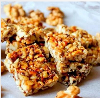
Козинаки и грильяж