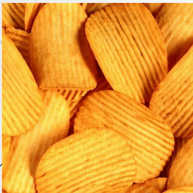
Чипсы и сухарики