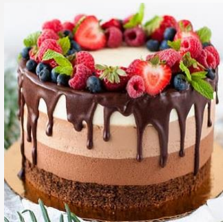
Торты и пирожные