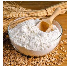
Мука и сахар